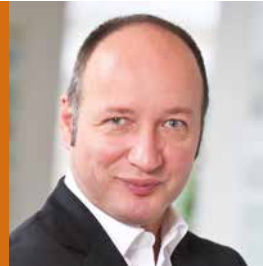
Claus Greiser Dipl.-Ing.

Minister für Umwelt, Klima und Energiewirtschaft Baden-Württemberg