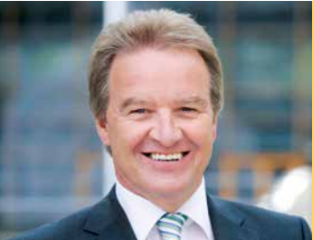
Franz Untersteller Mdl

Minister für Umwelt, Klima und Energiewirtschaft Baden-Württemberg